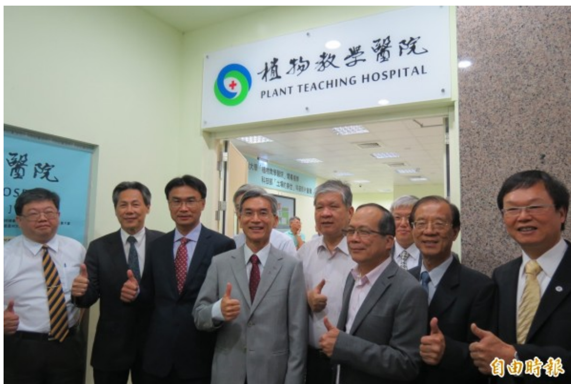
中興大學打造全台首座植物醫院，替植物把脈、開處方箋。

還想看更多新聞嗎？歡迎下載自由時報APP，現在看新聞還能抽獎，共7萬個中獎機會等著你：