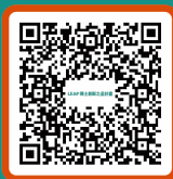
前往LEAP計畫粉絲頁按讚