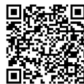
報名 QR Code

博士創新之星計畫 (LEAP) https://leap.stpi.narl.org.tw