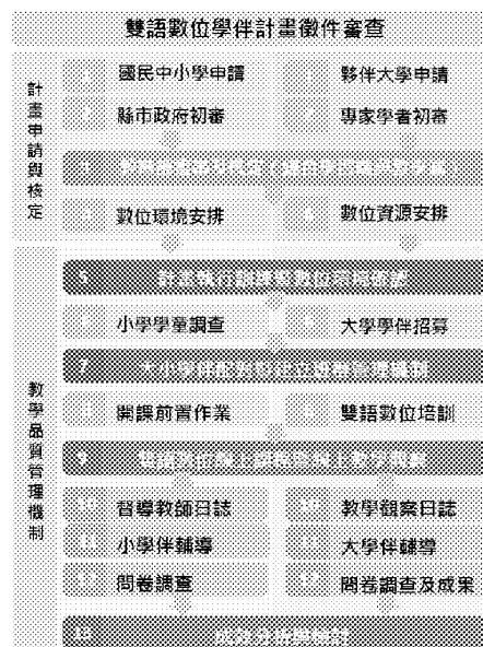
圖2 雙語數位學伴計畫實施流程