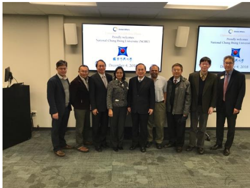
圖 3、GLOBAL AFFAIRS 中心拜訪