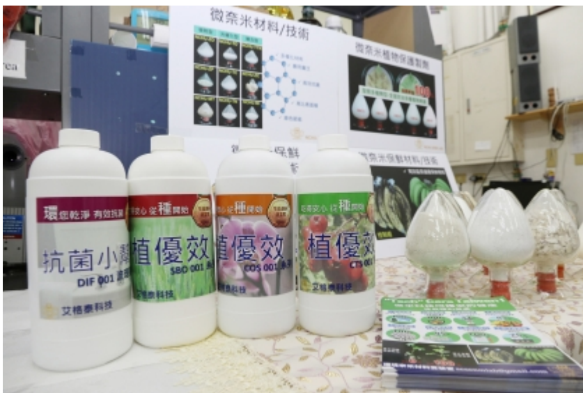
↑ 中興大學新穎環境友善微奈米材料團隊，以「微奈米天然資材於農產品生產與保鮮之循環經濟應用」研究成果，經激烈評選，榮獲第15屆國家新創獎學研新創獎。