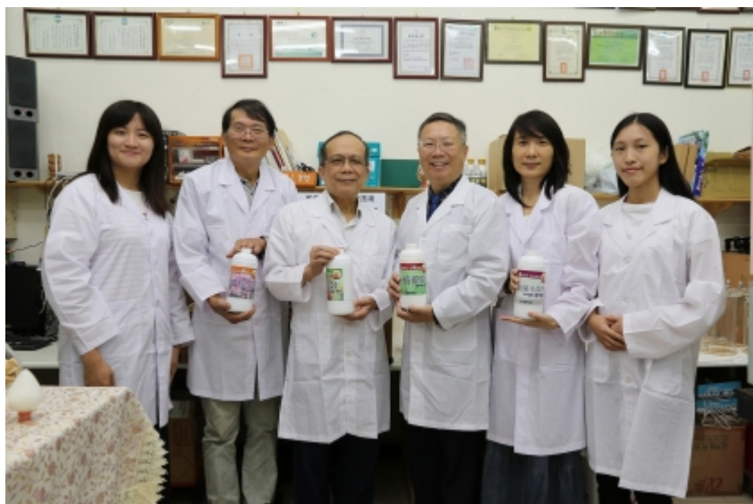
↑ 中興大學新穎環境友善微奈米材料團隊榮獲第15屆國家新創獎學研新創獎