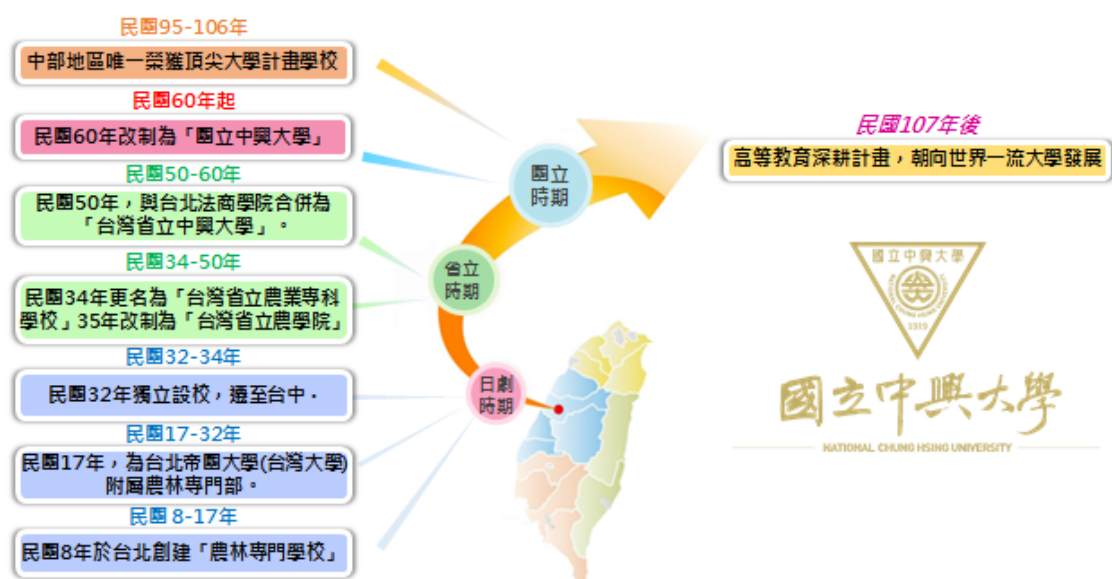
圖 1 本校歷史沿革示意圖

本校發展至今已設有文、農業暨自然資源、理、工、生命科學、獸醫、管理、法政、電機資訊、醫學院、循環經濟研究學院及創新產業暨國際學院等共 12 個學院，在農業科學、植物與動物科學、化學、工程、材料科學、臨床醫學、生物與生化、環境/生態、藥理學與毒理學、社會科學等十大領域表現優異，並於民國 95 年起連續二期為中臺灣唯一獲教育部「5 年 500 億計畫」頂尖研究型大學；及 107 年、112 年連續二期獲得「高等教育深耕計畫」，且逐年均獲增額補助，績效卓越。