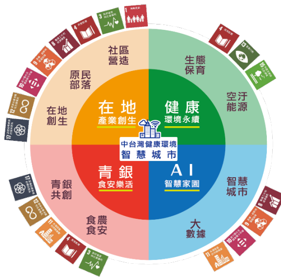
圖 4 本校 USR 發展藍圖

本校善盡大學社會責任整體發展藍圖，以協助中臺灣成為「健康環境智慧城市」為目標，並呼應教育部 USR 大學社會責任實踐計畫與聯合國 17 項永續發展目標 (SDGs)，鼓勵師生投入社會服務，持續建構學校實踐社會責任制度，訂定各項辦法鼓勵從事社會責任之教師與學生，永續推動大學社會責任與影響力。