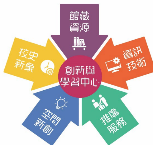
圖 3 優化圖資建置與服務發展重點目標

本校圖書資源建置與服務之未來發展規劃五大重點方向，包括：館藏資源、資訊技術、推廣服務、空間新創、校史新象，做為本計畫發展的主軸，如下圖：